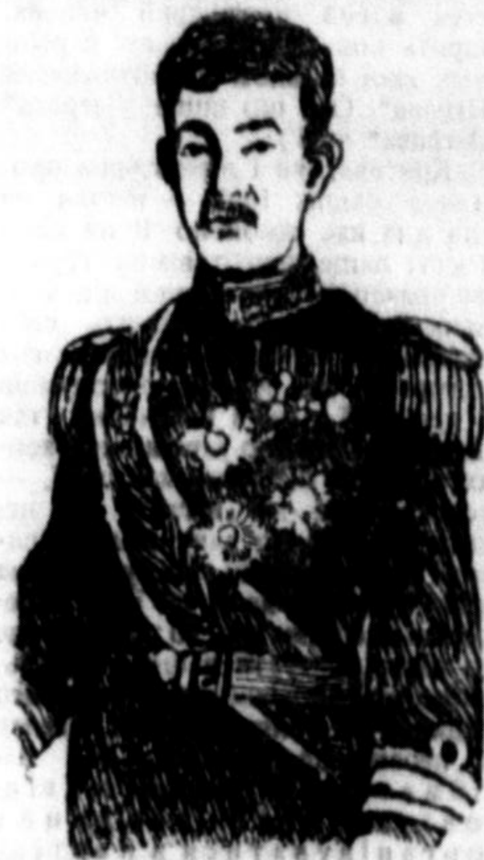
Японський мікадо (цісар) Йозехіто, який недавно зварював,