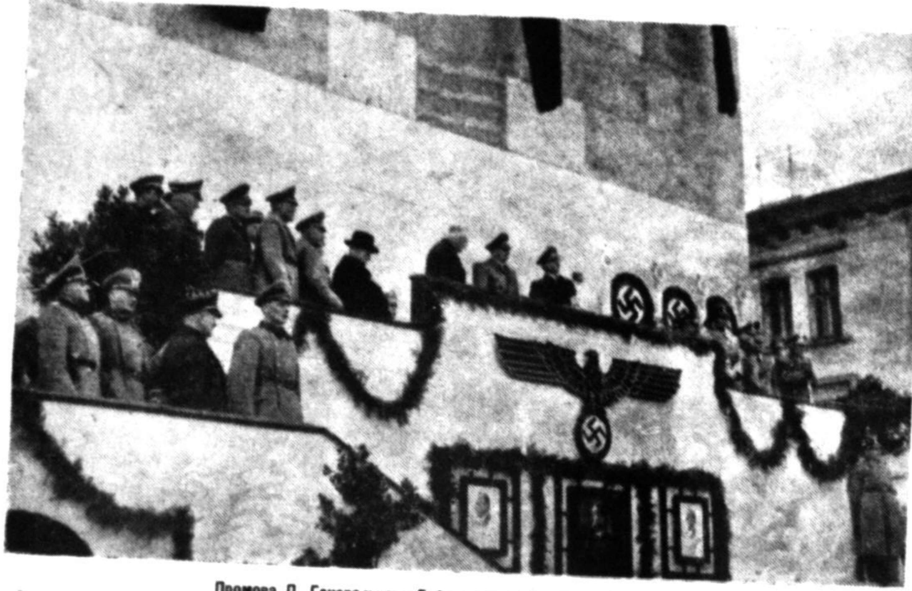
Промова П. Генерального Губернатора Мін. Д-ра Г. Франка.

Розшуную мужа мур. ДИКОГО ЕВ-ГЕНА, змобілізованого 28 червня 1941 р., вявезеного в напрямі Каїв». Кажуть, що накодявся хвилено в Гусятний, опісан неная про пього моднах відомогтей. Ласнаві відомості. Стапиславія, пул. Германа Герінга 6 в. Дяка Одьга. (2-3)