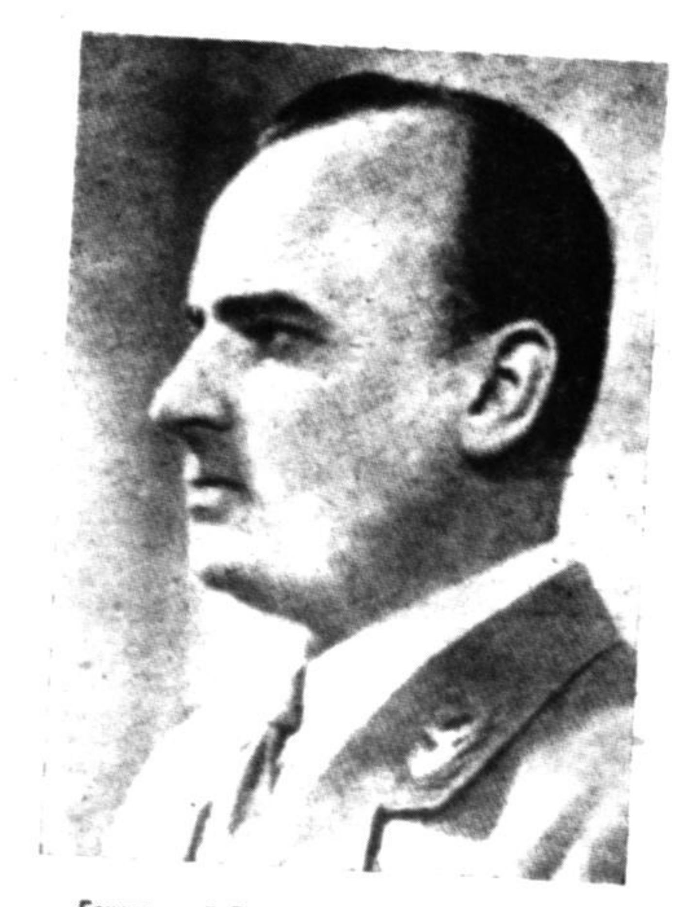
Генеряльний Губернатор Мін. Др Г. Франк

В тяжкій большевицькій неволі Українцям невільно було навіть подумати приязно про німецький народ. За виявлену прихильність до Німеччини енкаведисти вязнили й вбивали. Але український нарід глибоко в серці скривав і леліяв ті надії, які пілдержували його ду» а в найтяжчих хвилинах большевицької катівні — надії на Велику Німеччину, надії на остаточне визволення, яке могла йому принести одна тільки — Німеччина.